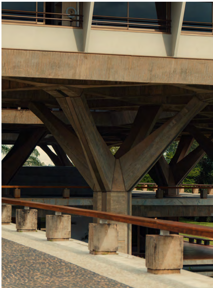
Embaixada da Itália, 1977. Arquiteto: Pier Luigi Nervi.

Experiência pensada para arquitetos, criativos, líderes culturais, designers, formadores de opinião, pesquisadores e todos que acreditam que o espaço molda comportamento e que cidades são livros vivos.